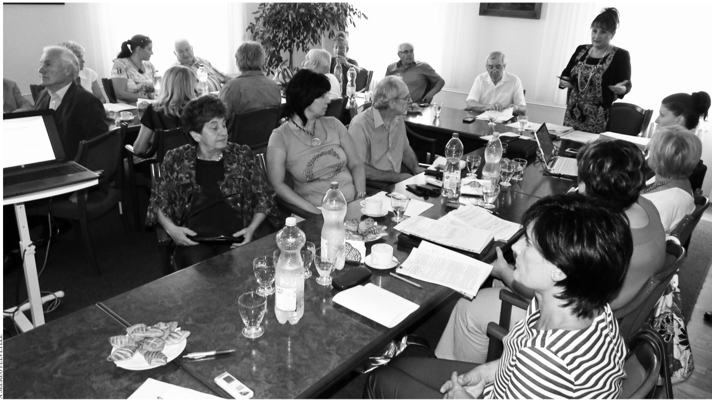
A békéltető testület tagjai a szakmai konzultáción

FOGYASZTÓVÉDELEM Több forduló van a békéltető testületekhez